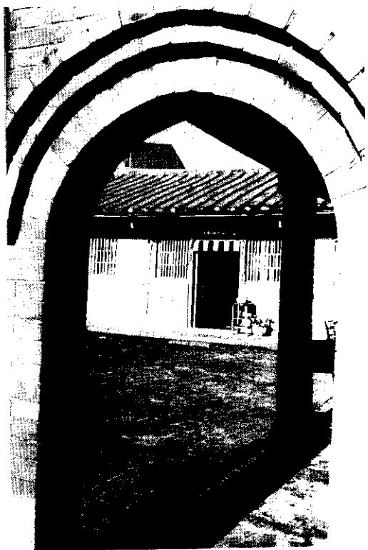
大埤鄉的農村風光——年代久遠的三合院

一，該會為方便，以真空包裝行銷各地，並擴及海內外，贏得海外同胞的喜愛及推崇，讓他們在外地思鄉打拼之餘，亦可嚐到家鄉的口味以慰鄉愁；而中央農政單位更補助經費興建酸菜專業區，讓酸菜再加工製造時更符環保的要求。