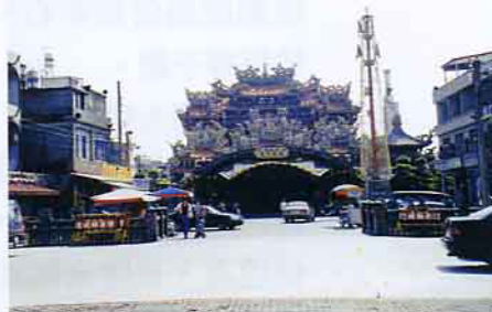
三層樓的巍峨東隆宮

定居，在海岸集成許多村落，他們一向信奉溫府千歲。在康熙45年時，舊稱崙仔頂的海灘上，一夜之間擱置大批自福州趁漲潮漂