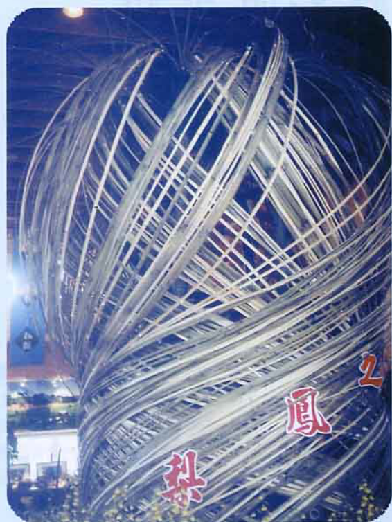
圖 中用了數百條粗竹條，和5位人員合力編製的竹鳳梨，編製好後，栩栩如生；擺置室內，象徵好運大大來，旺、旺，又大旺。