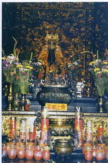
高在三樓的玉皇上帝