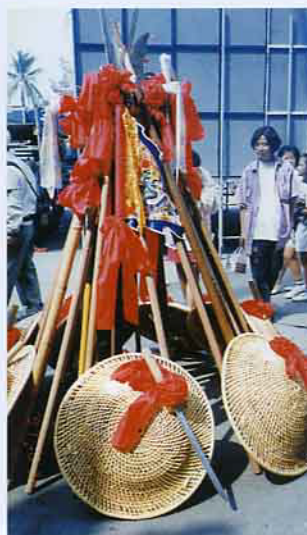
八家將用的十八般兵器