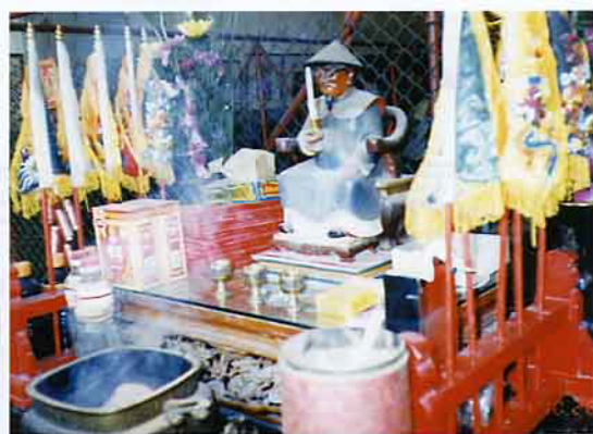
現代化的王船大爺

→ 安座，很快的溫王神威大顯，屢現靈蹟，遠近聞名，東隆宮溫府千歲聲名大噪，神威遠播，此地頓成爲信仰中心，信徒絡繹不絕。