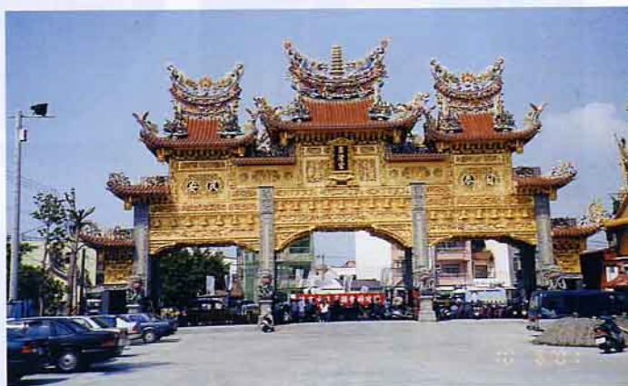
雄偉高大的東隆宮大牌樓

定居，在海岸集成許多村落，他們一向信奉溫府千歲。在康熙45年時，舊稱崙仔頂的海灘上，一夜之間擱置大批自福州趁漲潮漂