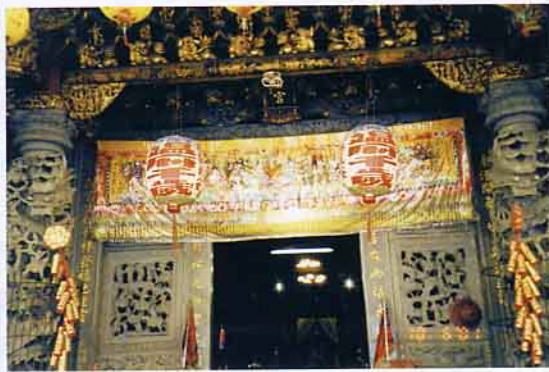
溫府千歲前的燈籠和八綵