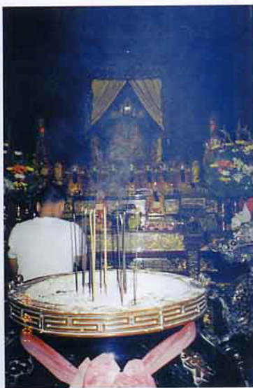
香煙裊繞的溫府千歲

沖過來的大木材，木材上書有「東港溫記」字樣，並且溫王在夜裡顯靈指示，祂希望在今鎮海里太監府舊地建造新廟，且要依照木材的大小長短，聘請各師尊照興建，還指定一段木材雕刻溫王金等，等東隆宮落成後擇定吉日