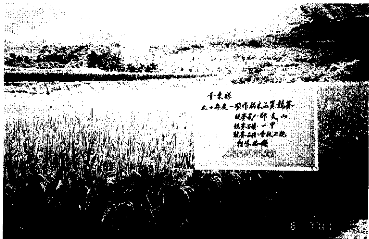
稻米品質競賽田間生育調查