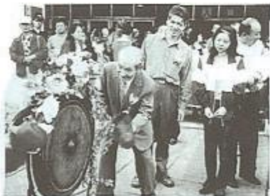
日本稻草工藝家前來進行交流並展現他們精湛的技藝