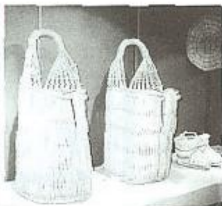
由稻草所編織成作品，別出心裁、琳瑯滿目