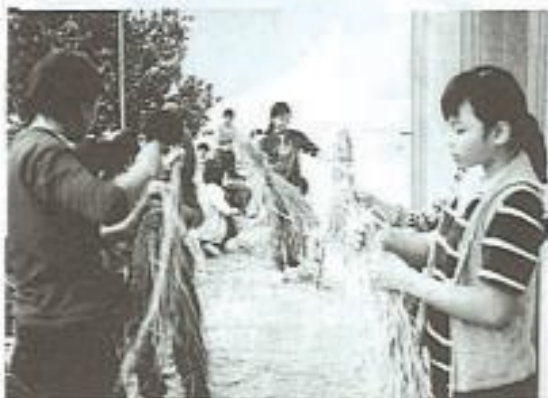
小朋友在參加稻草創意比賽