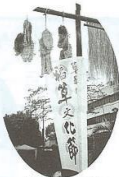
草鞋墩稻草文化節牌樓

12月8日至23日舉辦了「草鞋墩稻草文化節」活動，吸引了成千上萬的愛好稻草人士前往參觀，而掀起一股稻草藝術的熱潮。