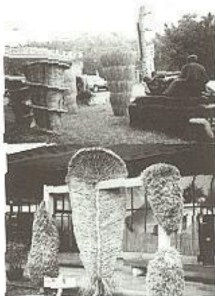
稻草景觀設計頗富創意及趣味