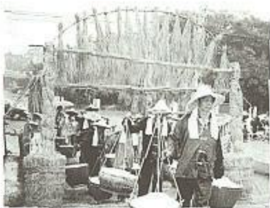
重視古道風情，古裝「鹿港擔埔社」