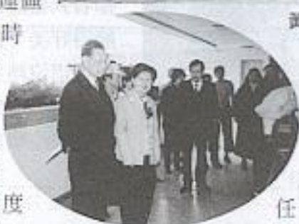
黃場長有才伉儷看現場揮毫