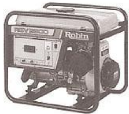
RGV2800 型 兼售汽油電焊機

汽油發電機，電壓穩定，電力充足，附大型油箱，堪長時間使用並有充電電源，採用電子點火引擎R650-RGV13100