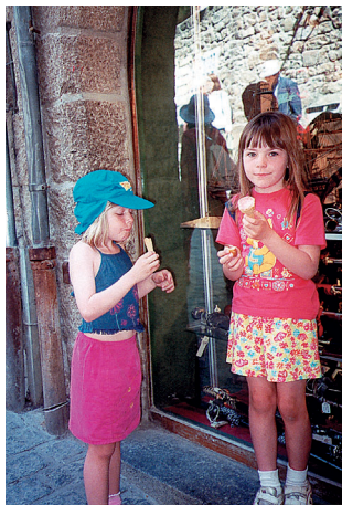
聖米歇爾山窄窄巷道，永遠有潮水似人潮（可愛的法國孩子）

→「修道院」有段距離，窄窄巷道，似也永遠有著潮水般人潮，至於城下停車場汽車群，更似一隻隻蓄勢待飛的金龜子。