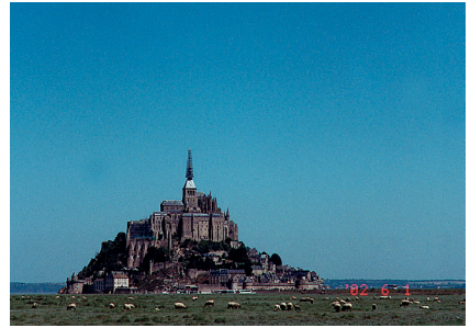
聖米歇爾山素有世界第八奇景美譽

我不但佩服曾為修道院努力的人，也感動千年來朝聖者毅力，不過，以現在整座城熱鬧氣氛來說，和我想像中