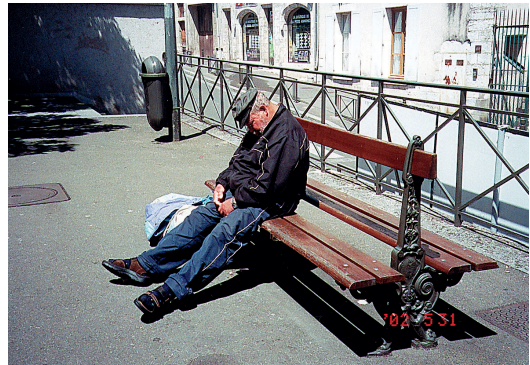
在杜爾街上所見的疲倦旅客，是否剛朝聖回來

曾看見一篇報導，說是這裡有家布拉媽媽蛋餅店，不知午餐吃飯的餐廳，是否就是這家歷史老店，只見第一道端出來的，就是個如披薩般的大蛋餅，雖然味道差不多，