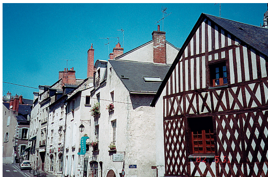
波洛瓦市行人稀落，大家都在看法國對塞內加爾足球賽

我們到達香波堡時，已是下午4點了，導遊說來到這個古堡的人，最想看的設施，是進了大廳後，所見的那個空心旋轉樓梯，傳聞是達文西設計的這個