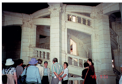
傳聞由達文西設計的旋轉樓梯(香波堡)

這樣的設計，有人推測是王公貴族們，爲了要保持生活作息神秘，希望在上下樓梯時，不讓僕人看到，不過，我比較相信的說法，它是爲了降低敵人侵犯速度，即敵人一夥兒爬上樓梯時，會被樓梯構造及樓層設計等，弄得一團迷惑。