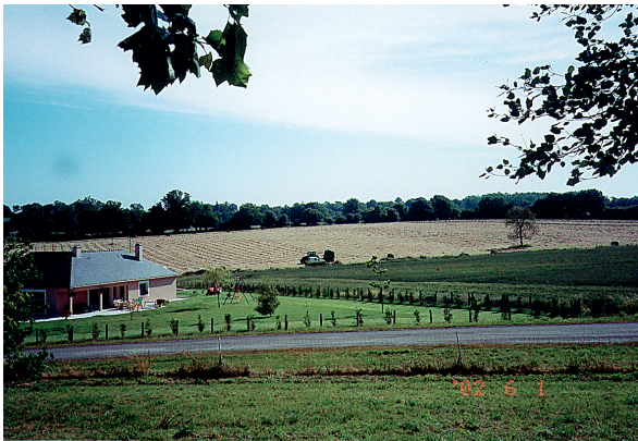
從杜爾驅車到聖米歇爾山，沿途所見盡是酪農天地

完成此建築物經典，四週流沙險灘環繞，潮水來時，孤島挺立海中景色，令人動容，千年歲月滌盡風流人物，孤懸滄海中的聖米歇爾山，是光陰磨不去的見證」，旅行社提供的資料，簡單扼要也見真情。