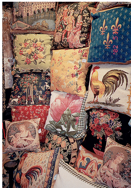
從禮品屋所賣紡織品，可推知國王的夢想