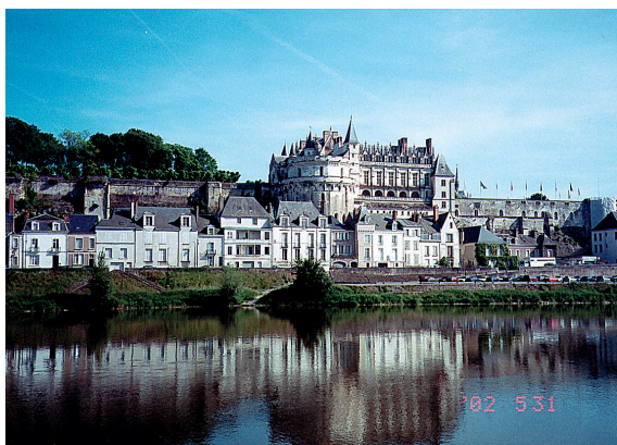
安厝達文西遺骨的安波堡 (AMBOISE)