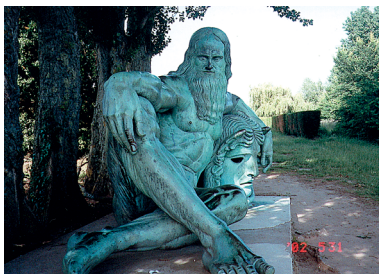
不知達文西會不會想念義大利故鄉