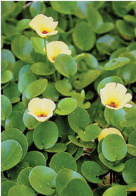
漂浮精靈區的水金英

色盤、綠濤掠影走廊、綠海瀾宮、星貝希望花園、漂浮精靈區、海洋文化之星、椰林美食區等8區；室內部分有海洋神話館、美麗人生館及蔚蘭海岸館3大館。不同展區感覺都不同，有的像家中後院般親切，也有彷彿置身歐洲般浪漫，也有勇於創新的創意設計，還有親自動手栽種的DIY區。花展內容豐富，萬紫千紅，不容錯過，歡迎各位朋友踴躍前往參觀。