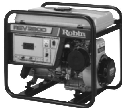
RGV2800 型 兼售汽油電焊機

汽油發電機，電壓隱定，電力充足，附大型油箱，堪長時間使用並有充電電源，採用電子點火引擎R650-RGV13100