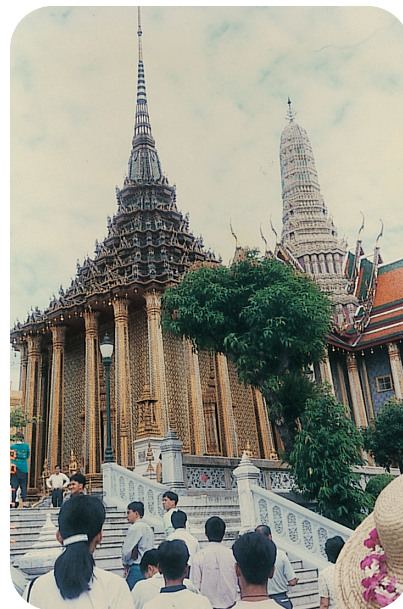
高高圓柱的傘形七級浮塔

但自拉瑪六世以後到現在的九世王蒲美蓬陛下，放棄這雄偉壯麗的皇宮，住到有中國式的庭院威曼麥的皇宮裡，那兒古木參天，十分肅靜，優雅，表示平民化，禮賢愛民。