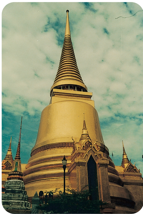
金碧輝煌的金鐘形高塔

大皇宮是於1782年，由拉瑪一世國王開始建造的，周圍繞有宮牆的城堡。到了繼位的節基王朝，逐漸擴建成今日的大皇宮。面積有21,800平方公尺，宮牆周長