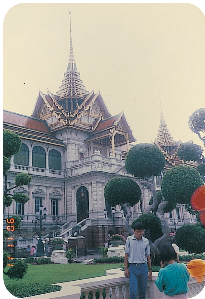
供奉穿著金縷衣的玉佛寺外貌

買票從大門進入皇宮，在這恰克里宮的旁邊，首先看到的是一座金鐘形的最高最新佛塔，圓錐形的塔尖，高入雲霄，塔身有22道金環，在晨曦中金光閃閃，像一位穿著金縷衣的舞者；黃昏時，金黃色的塔身與夕日餘暉相映，造成時空超越的想像。塔內供奉佛像，平日沒有開放，塔門深鎖，