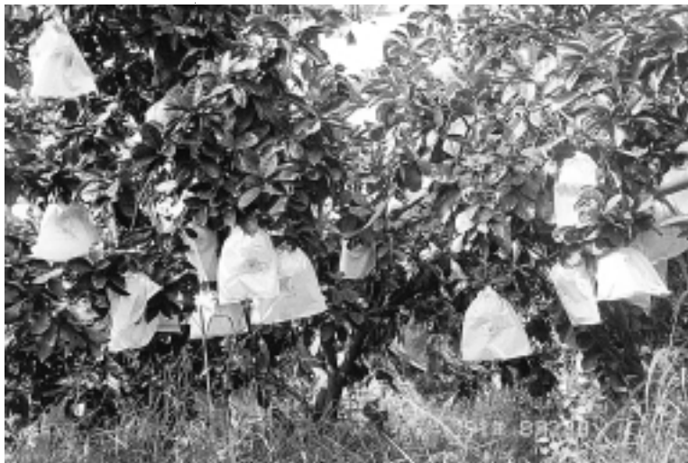
果園中生長的蜜柚，採用草生栽培

人皆稱讚一極品。只是產期略晚，中秋節過後，霜降前後才可採收，日夜溫差愈大，愈甘甜，台視節目一位製作人之母親，說她長這麼大年紀，從沒吃過這麼好吃的柚子，查問何處可買到，那是我朋友送給她的，但是他又告訴她，怕過份宣傳，而他以後買不到。 🐎