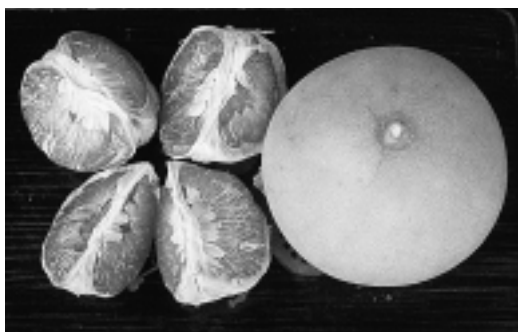
蜜柚的品質相當好，品嚐過的人都說讚

徵稿：為讓各產銷班相互了解彼此動態，歡迎產銷班員主動執筆提供各種產銷活動情形，使「產銷班廣場」的資訊與你我相連。稿費從優，500字左右，附圖更佳。來稿請寄「豐年」半月刊編輯部。