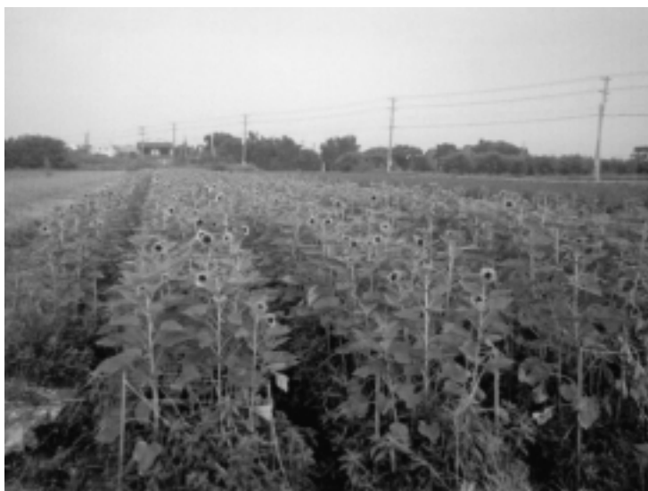
唐阿宗先生露地栽培花卉0.5公頃