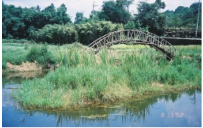
溼地成為桃米社區居民的聚寶盆

佔地18平方公里的桃米里，在921大地震中有三分之二的房屋全倒，社區居民遭受巨大創傷。經由農委會特有生物研究保育中心與新故鄉文教基金會的協助，配合農委會生物多樣性保育方案的推動，桃米里社區居民學習如何利用週遭寶貴的自然生態資源，建立台灣第一個自然生態村。根據特生中心提供的資料，桃米地區擁有19種蛙類（全台灣共29種）、42種蜻蛉及60種鳥