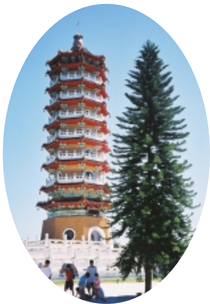
紅橘相間的慈恩塔與新鋪的白沙地相映成趣