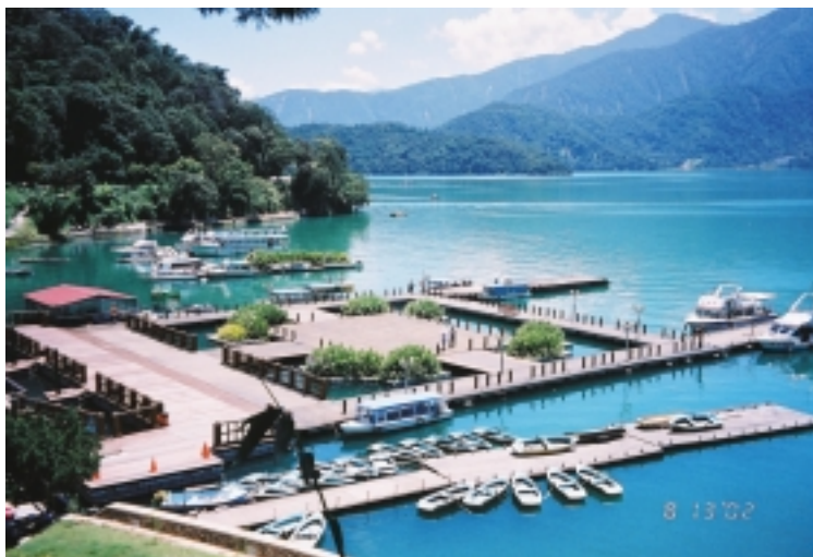
水社碼頭改造之後成為風景秀麗的觀光景點

官先生說，社區居民一開始也很懷疑，生態保育在社區行得通嗎？要怎麼跟經濟活動結合？但在特生中心與新故鄉文教基金會的持續努力下，居民逐漸體認，由一點一滴的努力慢慢累積起