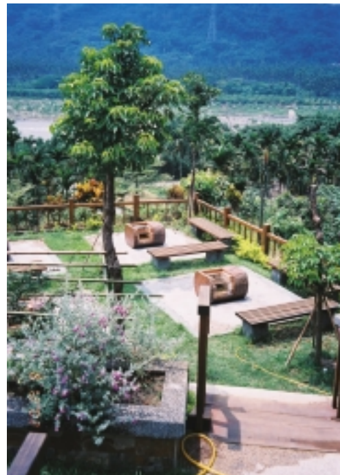
福龜村設施規劃中之烤肉區