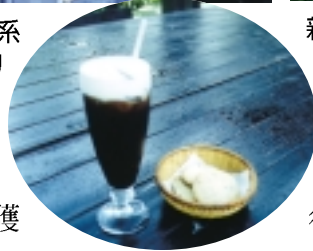
薰衣草奶茶與餅乾，美味可口

富有特色，而且曾經參加農特產品的評鑑獲得三等獎的殊榮。在這裡可以購買到花草盆栽，也有薰衣草製成的沐浴鹽、香皂，而且可以坐在大樹下的原木鞦韆，吸引新鮮空氣。