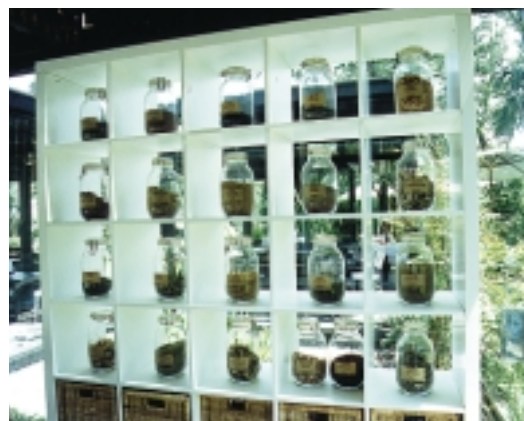
香草系列產品的樣品