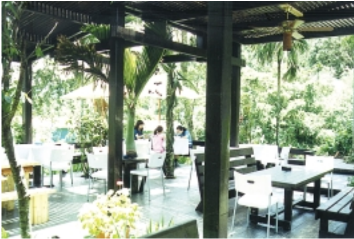
經過設計的庭園造景，在這裡品茗聊天，富有詩情畫意