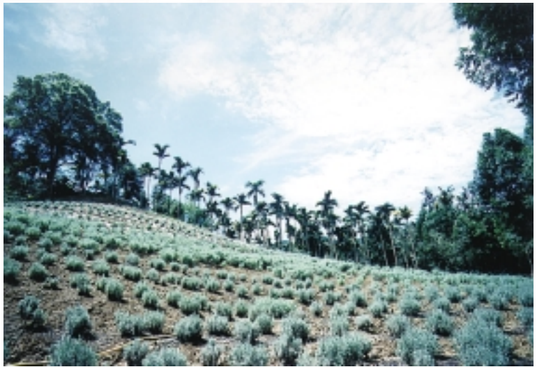
坡地上鋪滿紫色花朵的薰衣草，與晴朗的天空，構織一幅優美的圖畫

薰衣草森林座落於台中縣新社鄉山區，佔地4千多坪的坡地，遍植各種香草植物，包括羽狀薰衣草、齒狀薰衣草、甜蜜薰衣草、狹葉薰衣草等及迷迭