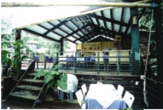
咖啡館供應香醇的薰衣草系列飲料、餐點，是遊客的最愛