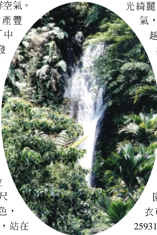
沿途小瀑布溪水澄澈，由上傾瀉而下，銀白色的水帶壯麗景觀