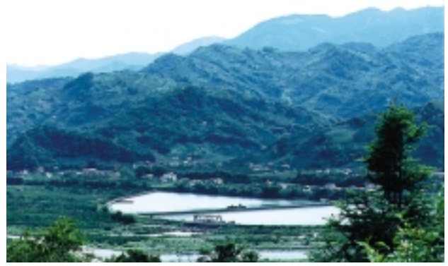
新社鄉山巒疊翠，山明水秀，美景如畫

富有特色，而且曾經參加農特產品的評鑑獲得三等獎的殊榮。在這裡可以購買到花草盆栽，也有薰衣草製成的沐浴鹽、香皂，而且可以坐在大樹下的原木鞦韆，吸引新鮮空氣。