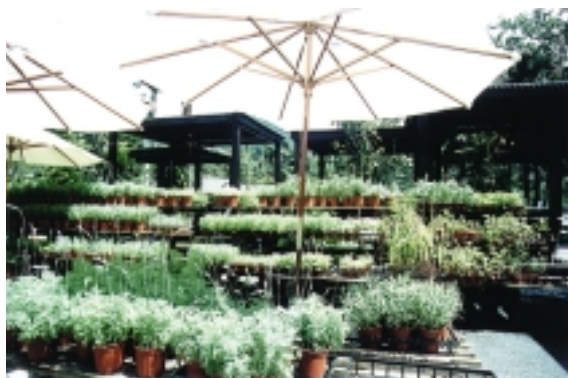
薰衣草花架，美不勝收