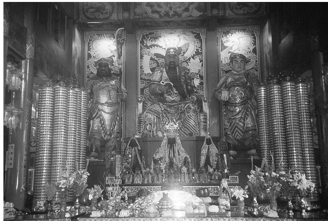
神龕內的武聖關公與關平、周倉

立，當中放置天公爐。大殿是傳統的五開間格局、正門鑄有對聯：「志在春秋功在漢，心同日月義同天」。正殿供奉關聖帝君坐像，高18尺，青銅鑄造，關帝右手持春秋，左手捋長髯，雙目炯炯，正氣自現眉宇，關平太子侍立左側，手執印信，英氣逼人；周倉將軍侍衛左側，手持青龍偃月刀，威武勇毅。福德正神與註生娘娘，分祀左右兩龕。走進後殿，正是太歲星君殿，殿內設置神龕三座，中龕安奉值年太歲星君，左