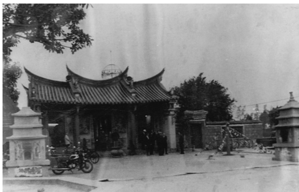
最早的五塊厝關帝廟