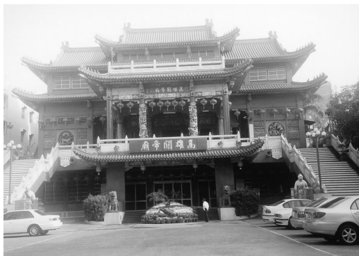
紅底白字的高雄關帝廟大殿