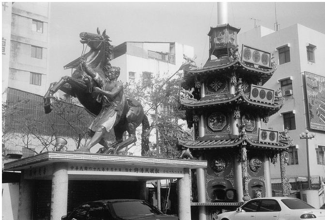
平台上20尺高銅鑄赤兔馬及三層大金爐