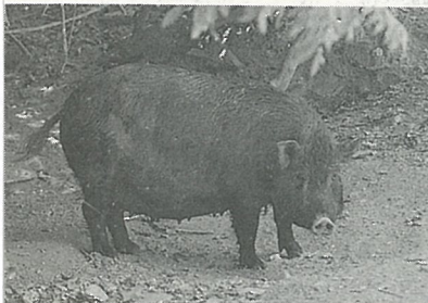
迷你豬採山坡地放牧