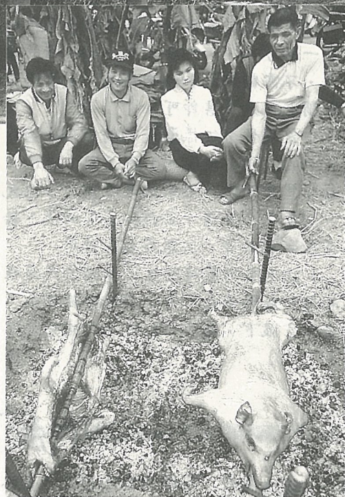
迷你豬為最佳烤乳豬的材料

據省畜試所台東種畜繁殖場陳文誠指出，由於豬和人類有許多相似之處，因都是雜食性，消化系統、皮膚、牙齒、血液都類似，所以，利用豬體產製的許多化學品與腺體分泌物，對於人類疾病的治療，有很大的貢獻。諸如：豬皮經過特別處理與殺菌，可做為灼傷患者