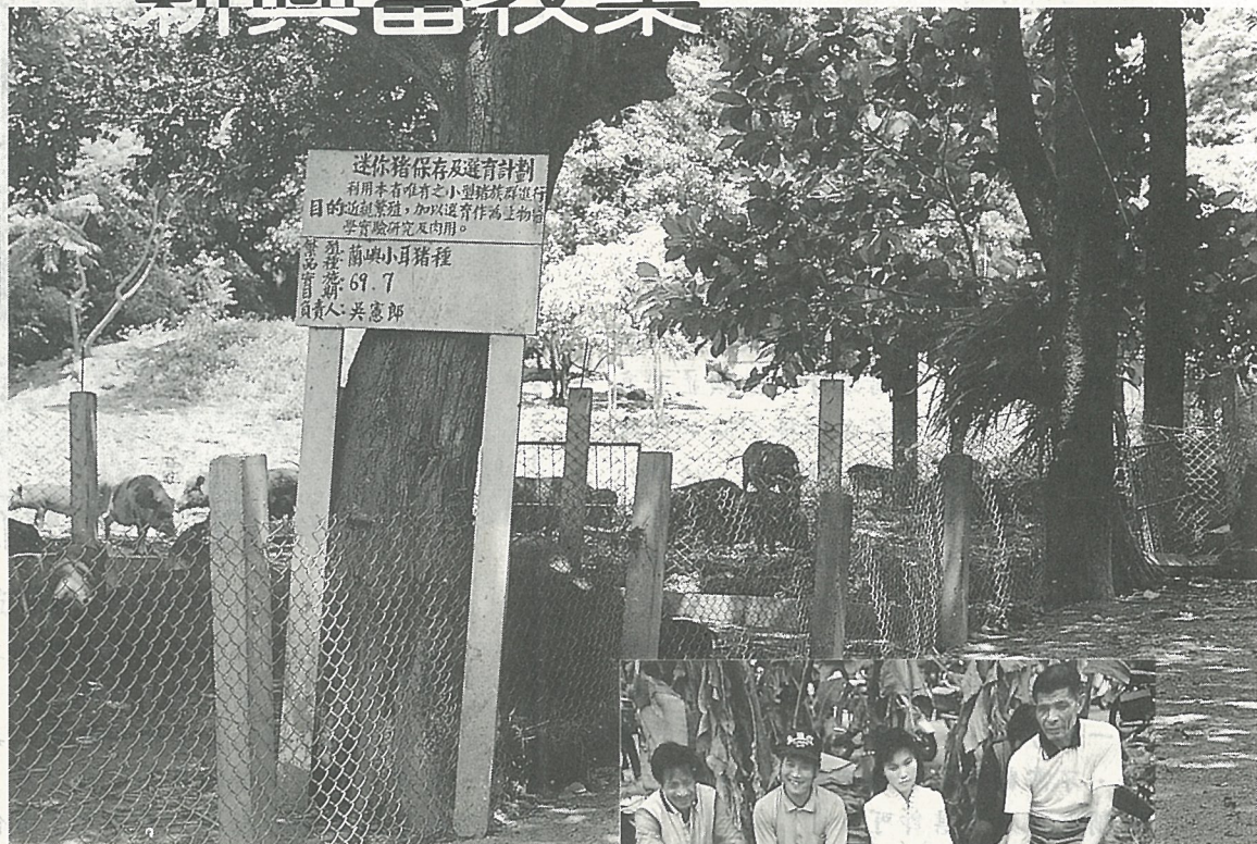
台東種畜場的迷你豬繁殖場地

蘭 嶼島上土生的小耳種迷你豬，為本省最小型種豬之一，因體型嬌小，性成熟快速，節省飼料及適合醫學研究之特性，尤其體重接近人體，在醫學方面頗有價值。隨著醫學研究逐漸趨向慢性疾病，例如心臟病、高血壓及許多內分泌問題，以及藥理學上用藥量實驗等問題，近年來更證明豬為最適合之實驗動物。近幾年，由於民生經濟的繁榮進步，本來是實驗室好材料的迷你豬，在消費者好奇之下，成為烤乳豬的好豬材，而且，也成為表演娛樂節目的廳豬好手。由於需求量大，將成為一項新興的“精緻農業”。