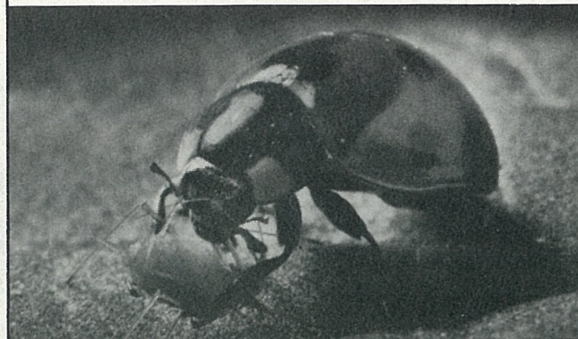
農業周刊15卷32期32頁 sevenspotted lady beetle 應該是七點瓢虫

本次大會所有演講均有中文翻譯，歡迎踴躍參加。國內學生報名一律免費優待，憑學生証入場。