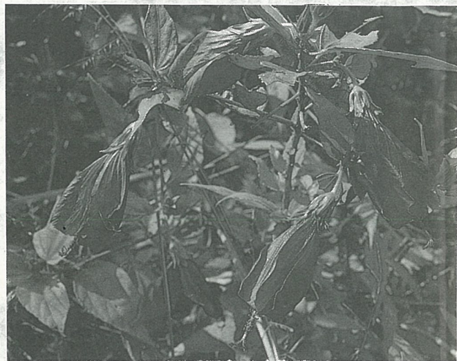
花瓣旋卷閉合的南美朱槿

南美朱槿 ( Malvaviscus arboreus ) 為常綠性灌木，葉身為卵形，葉端為3淺裂狀；花色純紅，花梗較短，花