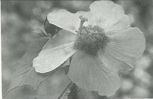
山芙蓉花瓣微向後傾

但均不致使植物死亡。可將肥皂切碎片，加入噴霧器內加水混勻後噴佈，直至控制病情為止，若病況嚴重則可予以強剪，殘部噴佈，較易控制。 ■