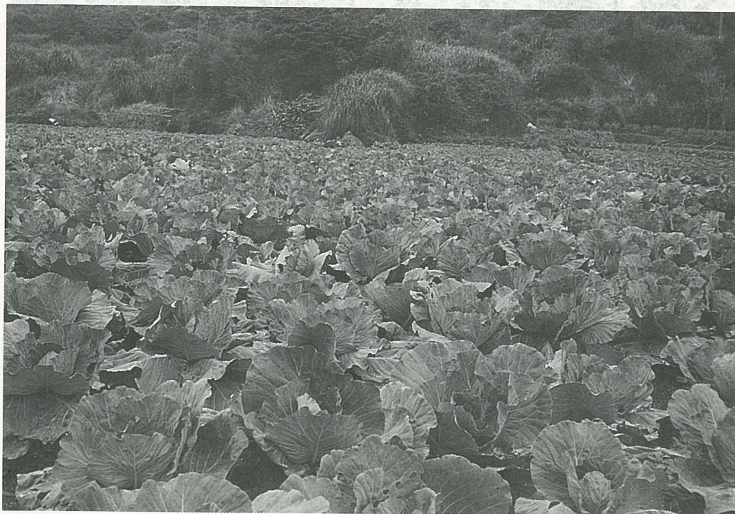
士林冷水坑蔬菜專業區菜色多，品質好。

炎 熱的夏季又來到台北盆地，你想在繁忙之餘，輕鬆一下，享受陽光、涼風、綠野，充滿鄉村風味的星期假日嗎？不妨走一趟士林觀光菜園