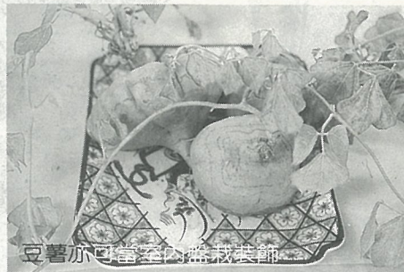
豆薯亦可當菜蔬或製成醬

炎 炎夏日，人人都愛吃清淡、爽口、不膩的食物，高雄區農業改良場最近介紹南部特產作物“豆薯”的食用法，推荐蛋炒豆薯、蝦仁肉丸湯、三色錦、肉絲豆薯、五彩沙拉、菜肉餛飩、蛋香鮮蔬等好吃又好料理的夏天開胃菜。