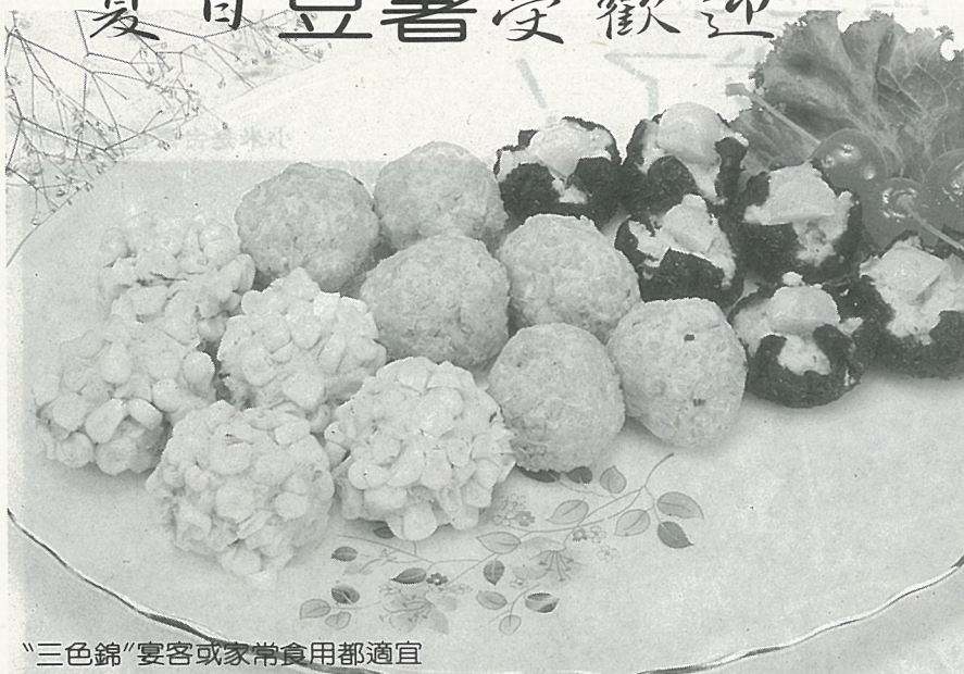
“三色錦”宴客或家常食用都適宜