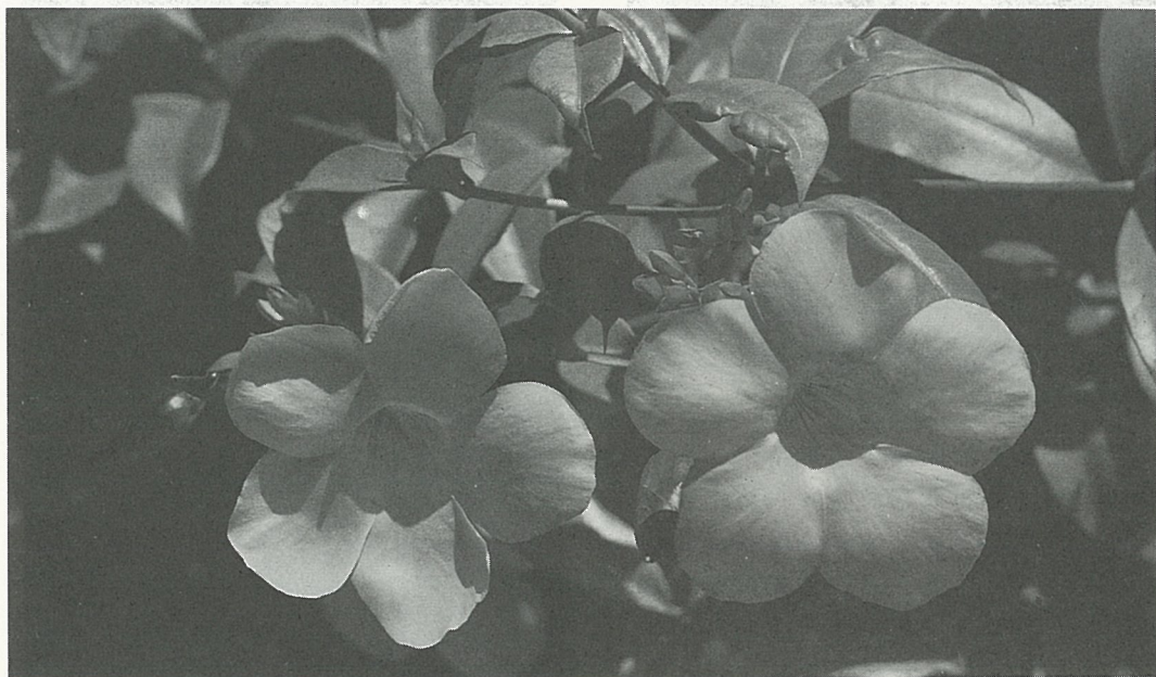
軟枝黃蟬明艷耀眼

你是否喜歡爬藤植物？它可是植物中最能表現線條美的自然畫家哦！隨著日曆一頁頁的撕去，秋天早已來到了人間，微涼的秋風中帶來陣陣瑟縮的氣息。你是否想擁有一個既美又多情的秋天呢？與其抱怨秋天，不如動手來製造色彩，增添一點秋天的浪漫風情，就讓我們從爬藤植物開始吧！