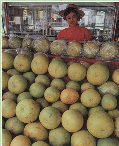
麻豆街上的白柚果攤

選購時，宜挑選每個果粒重量在2.5~3.5台斤者最為適宜，無論汁量、甜甘度，都最上口。同時，注意挑選