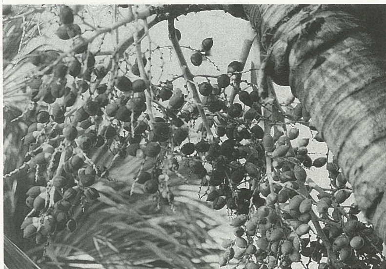
聖誕椰子果子成熟，明艷動人。

• 台灣海棗 ( Phoenix formosana ) 這是台灣本地自生種，單稈略呈彎曲狀，幹高5~8公尺，幹徑較粗肥有20~25公分，幹色褐黑，葉柄基部殘留在幹