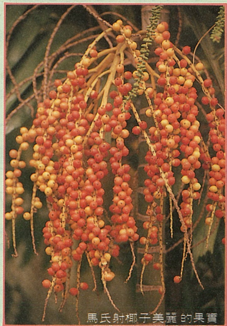
馬氏射椰子美麗的果實

在一般人們印象中，棕櫚科的植物有著細長的莖桿，綠色的葉片叢聚於其頂端，外觀經常是一片綠意