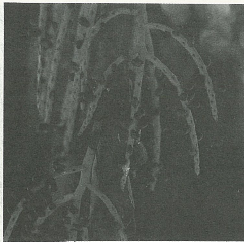
雪佛里椰子花後結綠色果實。