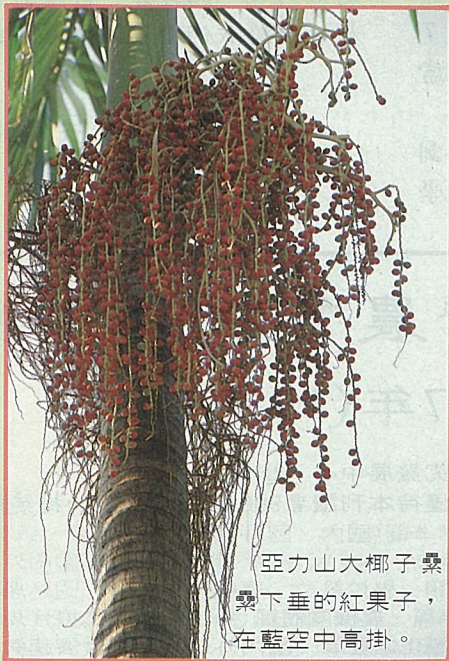
亞力山大椰子纜 纜下垂的紅果子， 在藍空中高掛。