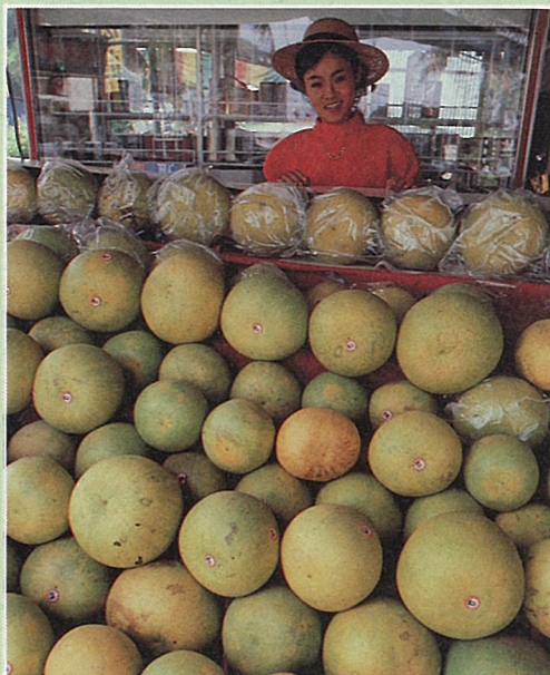
麻豆街上的白柚果攤

選購時，宜挑選每個果粒重量在2.5~3.5台斤者最為適宜，無論汁量、甜甘度，都最上口。同時，注意挑選