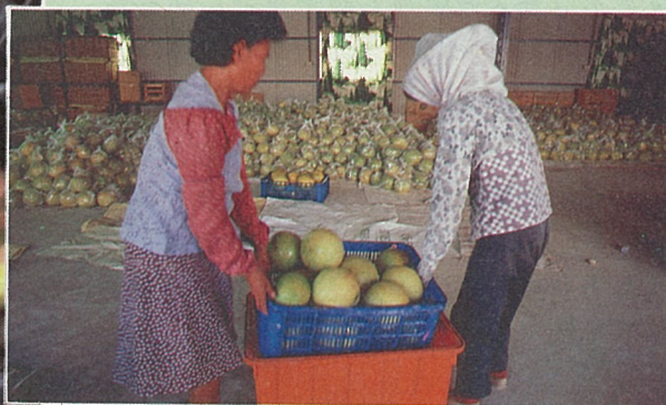
經防腐處理，白柚可長期貯存。