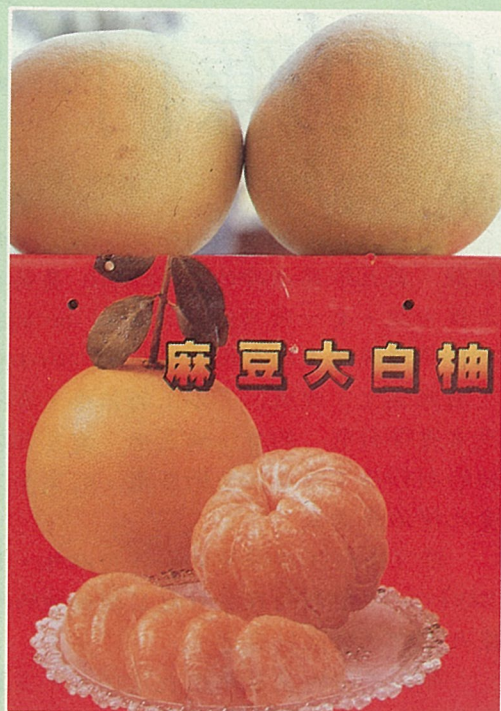
白柚香甜可口，略帶酸味。