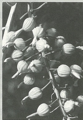
封面：月桃子