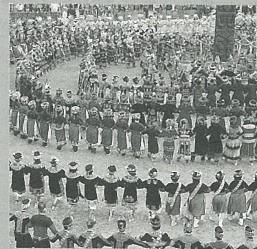
封面：豐年節