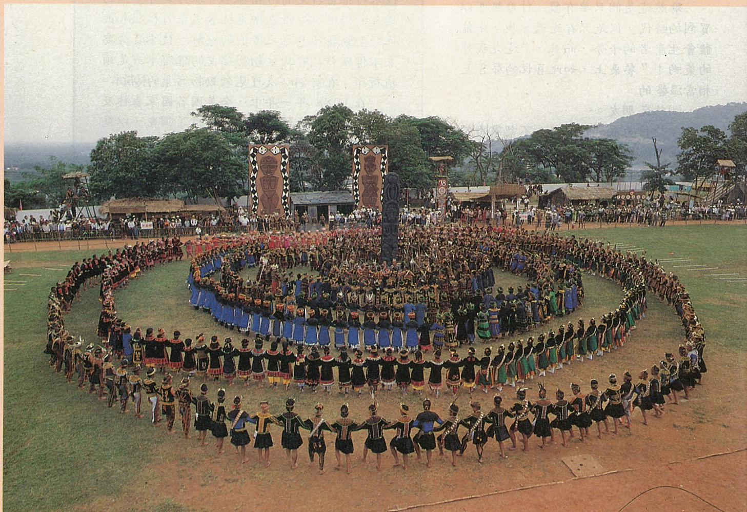
八鄉聯合豐年節盛況

各項儀式包括迎靈、報信、獻祭、授勳、舞蹈及技藝表演。今年豐年節的主題是“傳統的歸傳統”“山地的歸山地”，藉此聯合豐年節活動，讓山地傳統文化，得以薪火相傳。