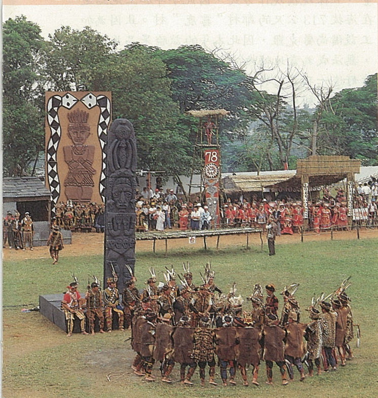
迎靈隊以傳統方式祭祀占卜