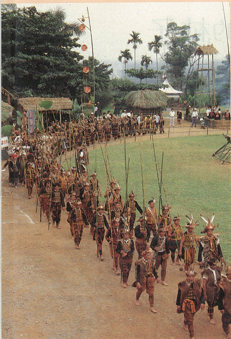
各族依序進場獻祭