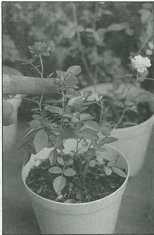
健康的植株才不怕任何病害侵襲。

應避免沾水，採用由下往上吸水較合適，可將植株連盆浸於水盤裏，等植株吸足了水時再倒掉盤中多餘水分。若花盆無排水孔則應每次只澆一點點水，過多時要將盆器傾斜，倒出多餘水分。生長勢強、根群旺及植株大者需水量較多；陶盆比釉盆及塑膠盆易失水，而砂質壤土比泥炭土及黏土易失水。植物缺水時應大量灌水以恢復生長，而根部浸水時應馬上將植株連土團移出，待土壤乾時再移入花盆。多次萎縮及復原會影響植物生長及開花，尤其是肉質植物應特別注意。