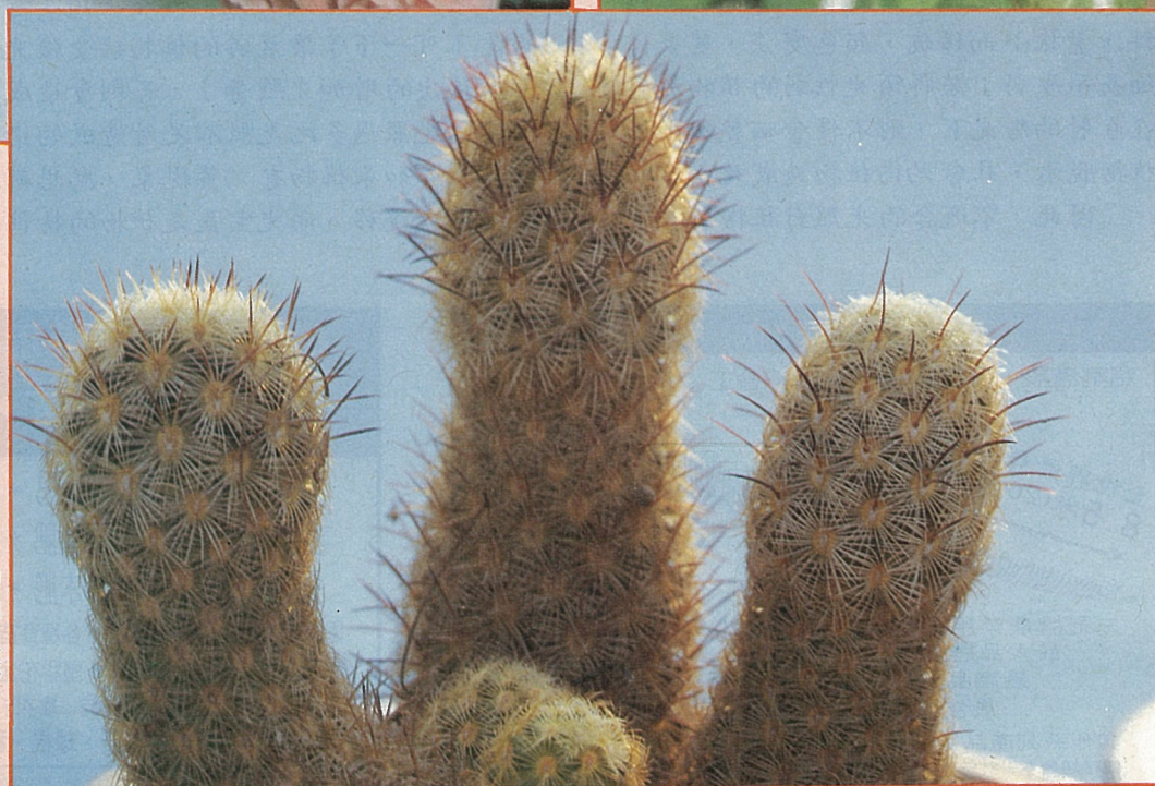
向光生長是植物的特性，記得要規律的旋轉植物，以免歪向變形。

→ 為了不使它歪向變形，一定要記得有規律的旋轉植株，使它光照均勻，平衡的生長；但是花芽出現時則要避免，否則會導致其不能適應而落蕾。