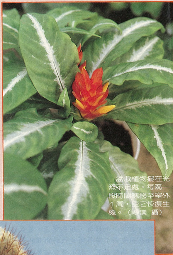
盆栽植物擺在光線不足處，每隔一段時間應移至室外1周，使它恢復生機。