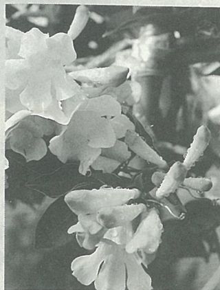
封面：蒜香藤