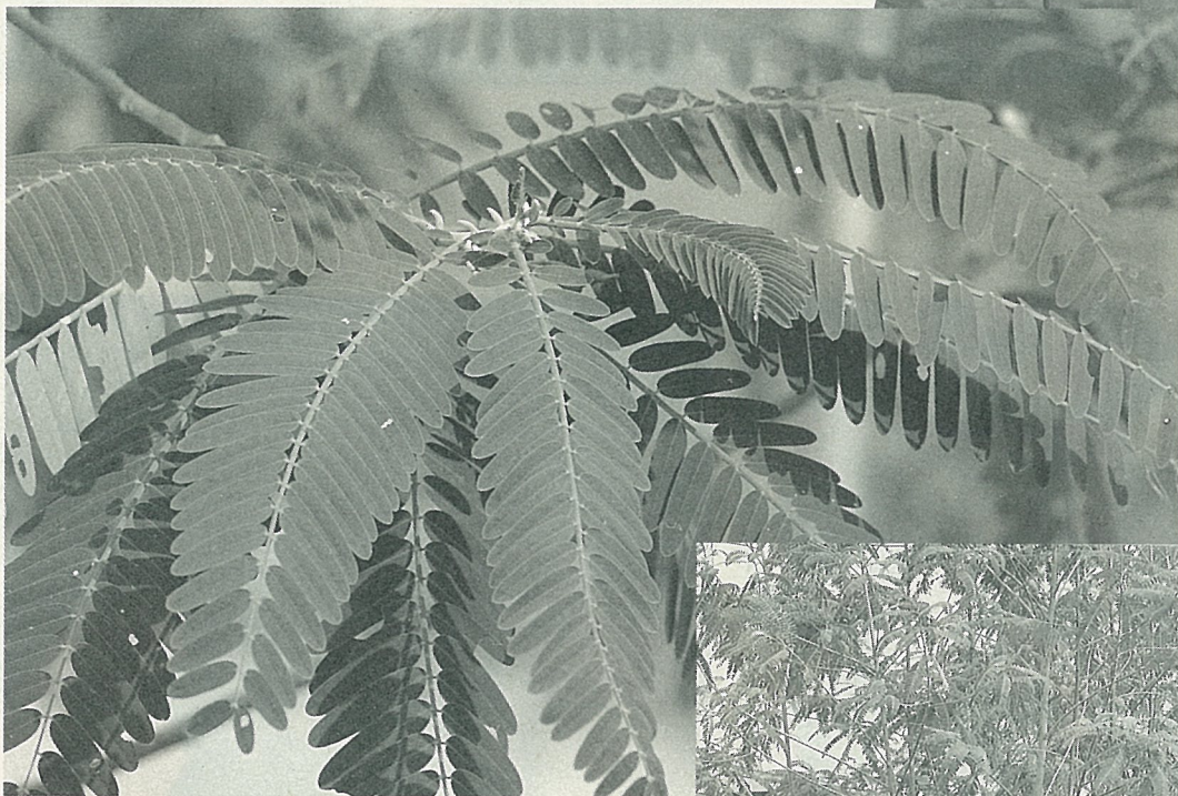
大花田青菜的羽狀小葉片，可和雞蛋一同炒食。