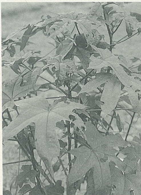
紅心百力菜有特殊風味

大花田青菜含有豐富的維他命A，可摘取其羽狀小葉片，或其花苞，加入雞蛋同炒。且可兼作防風林、遮蔭樹，以及田間的綠肥等之用，用途可謂不少。綠