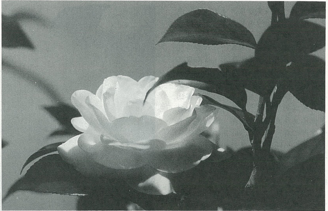
山茶花喜歡半日照的環境。

→ “茶花女”雖然潤跡於紅塵的青樓中，却不是枝棲南北鳥，葉迎往來風的殘花敗柳，所以，能博得純淨如阿蒙的一見鍾情，兩廂情好，綢繆繾綣。宛如劇中所詮釋著的真愛，藉以自然中的植物來傳達—白洋茶，茶花女不是當之而無愧嗎？無奈造化弄人，終於不容許她（它）長存於天地間！漫天的烏雲密佈，頓時雷雨交加，是以欲求茶花女不成為萎地落花也難！而至今留給人們的，只是花以人名，人以花傳的無窮感傷罷