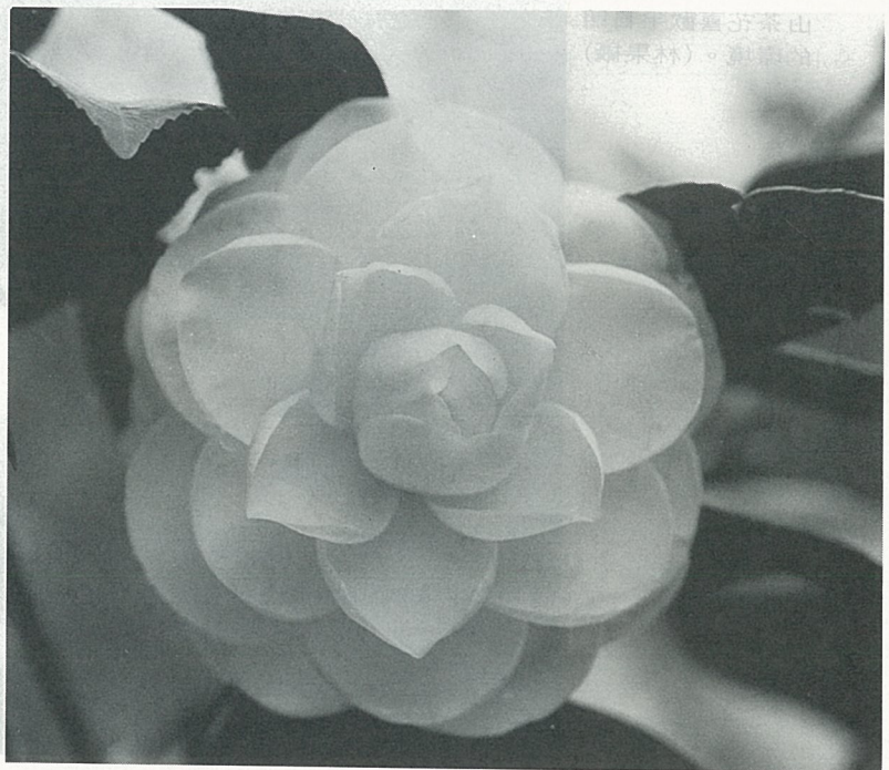
清新出塵的白茶花。 。