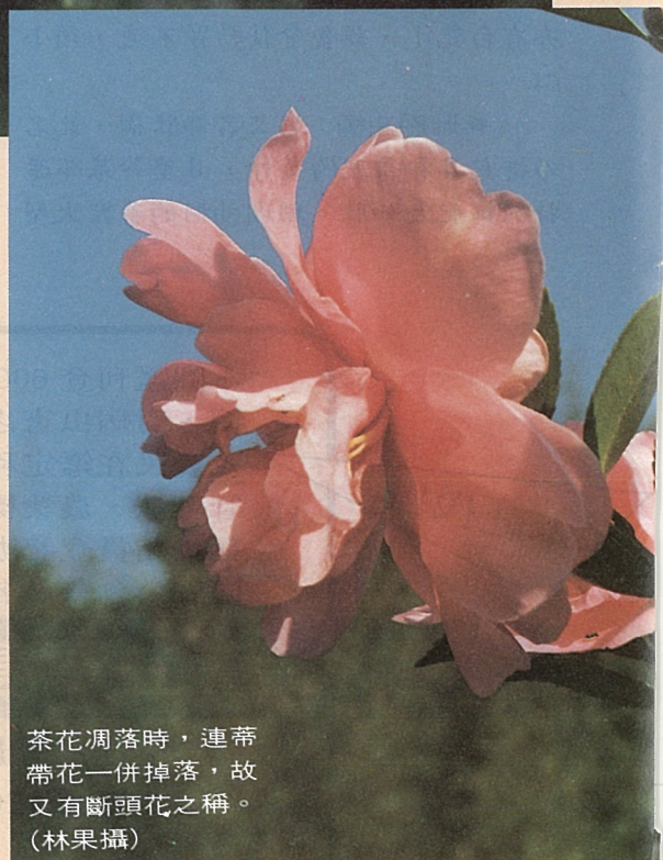
茶花凋落時，連蒂帶花一併掉落，故又有斷頭花之稱。