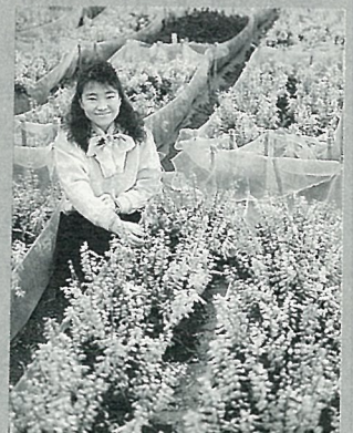
封面：一串紅 笑顏迎新春