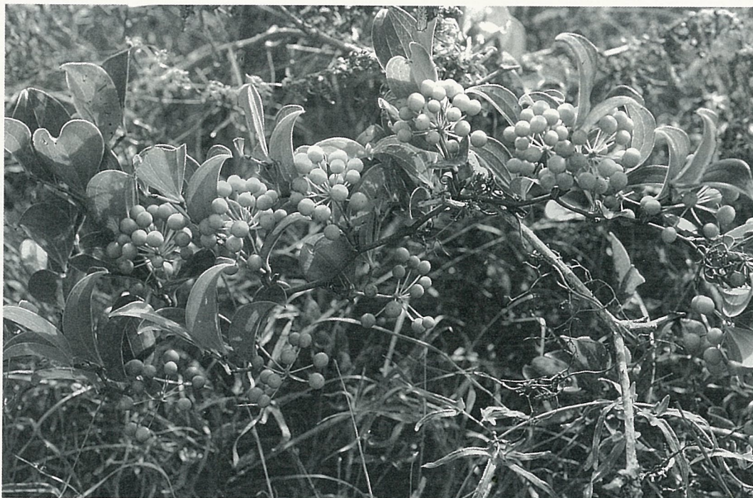
生長在山林間的菝葜，果實尚未轉紅。