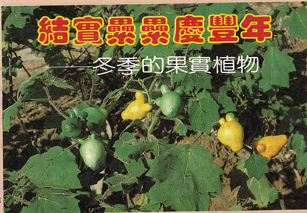
五指茄生長的环境