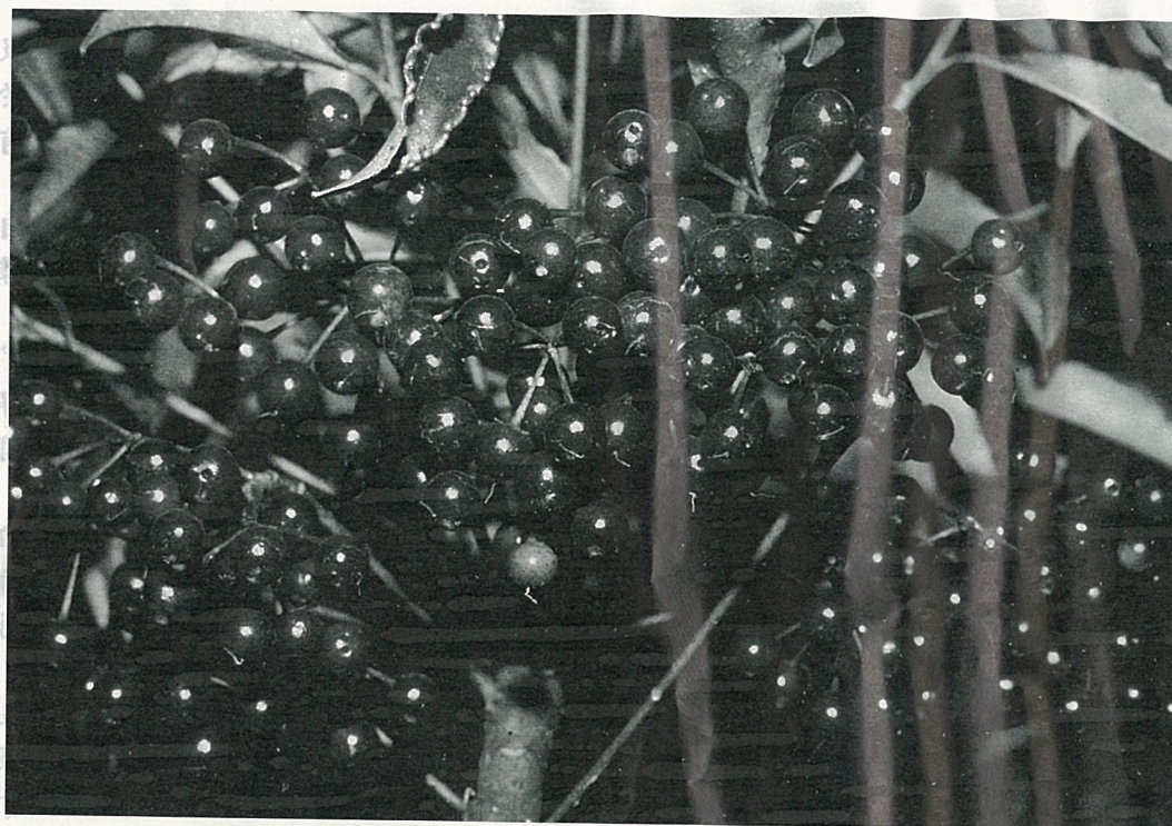
硃砂根剔紅的果實，忍不住令人喜愛。