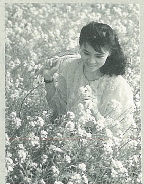
封面：油菜之美