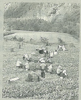
封面：武陵農場 高山蔬菜