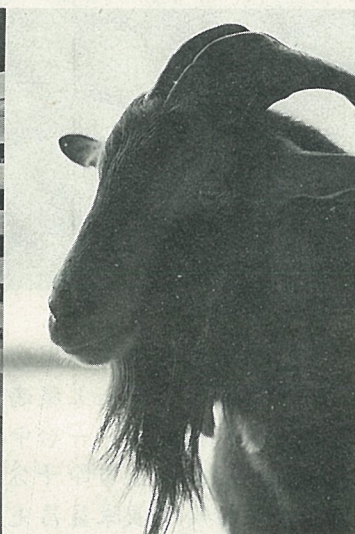
優秀的純種公山羊

屏東縣恒春鎮農會輔導羊農養羊3年有成，78年12月28日成立全國第一家種羊拍賣市場，以展示、比賽、展售及羊肉品嚐會促銷成功，為恒春羊肉共同運銷的產銷合理化邁出嶄新的一步。