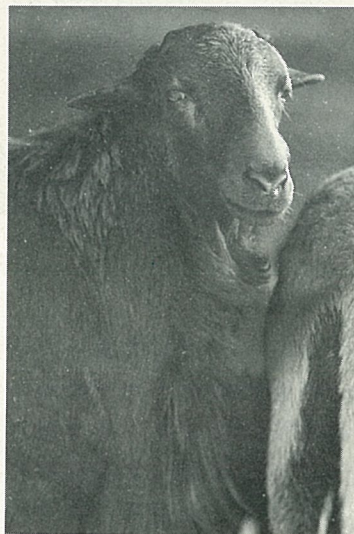
優秀的黑肚綿羊公種羊

造林貸款每戶最高貸款金額，每年由台灣省政府公告，以事業上實際所需投資金額為準；至於償還借款期限，則視新植、撫育、育苗、及樹種之不同而定，最長15年，最短1年。