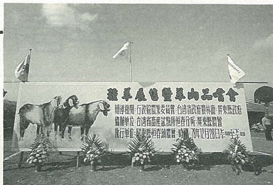
全國第一家種羊拍賣市場