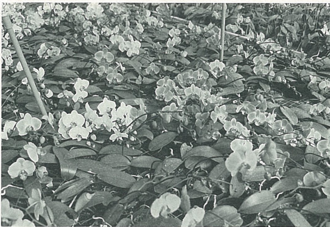
以每坪250棵的植株，做高密度栽培。

動溫室後，認為這種溫室好處很多，決定籌資205萬元鳩工興建。雖然目前工程還在進行中，但他已規劃好了工作項目，要擴大栽培面積，充分利用空間，如栽培床下層要做瓶苗、小苗栽培，若光線不足時用植物燈補充。同時還要繼續作近幾年來一直在做的“高密度栽培品種篩選”研究，最近他單株選拔到一棵原生蘭其分叉角度幾乎在90度，令他極為高興。