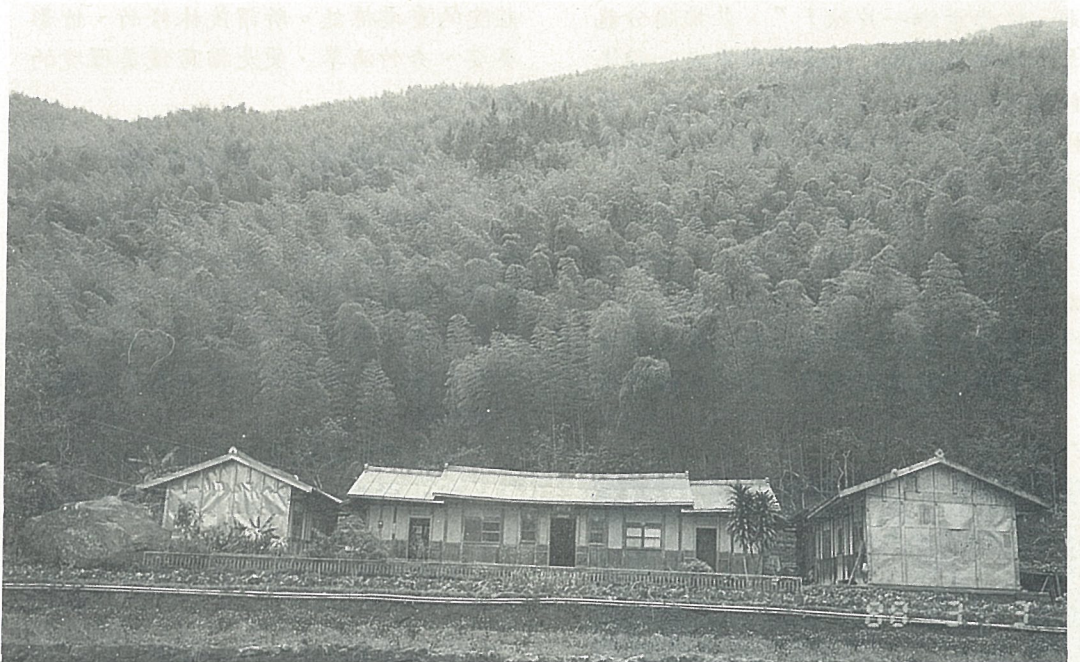
竹林，農家。