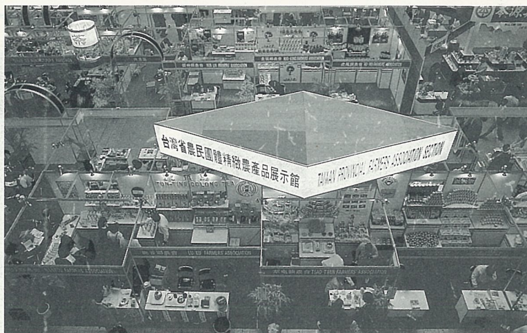
精緻農產品展示區

“1990 台北國際農產暨食品工業展”已於3月12~16日在台北世貿中心盛大舉行，這是國內農企業界的一大盛事，一方面展現精緻農業推行成果，一方面建立我國農產品新形象，拓展內外銷。此項國內舉辦規模最大的國際性農產食品展，成效良好，頗獲好評。