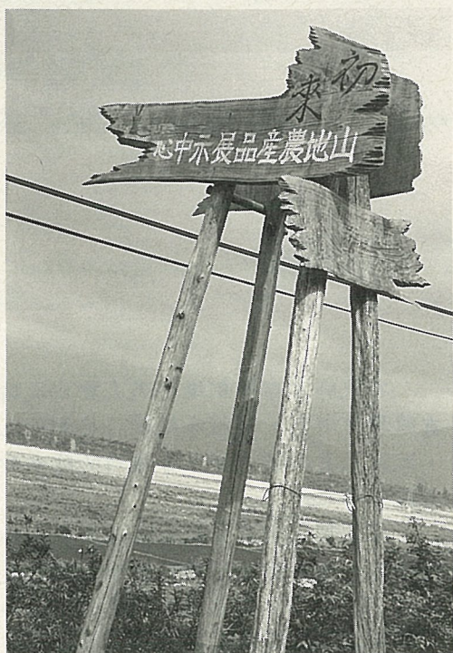
不經意看，就會錯過這個標示牌。

漸缺乏，尤其奇木難找，成品價在東部又抬不高，（如小桌子一組才賣15,000元，大一點的才能賣到30,000元），所以光靠雕刻也不是辦法。所以他也種一些李樹，甚至在南橫公路維護工程的地方打零工。