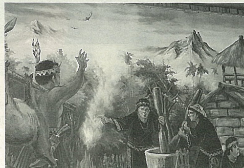
山地壁畫描繪布農族人的生活