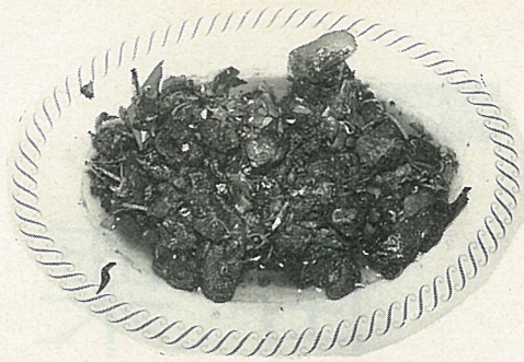
炸香菇是山地招牌菜