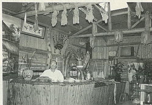
有興趣，不妨在此歇歇腳，嘗嘗道地的山地菜。