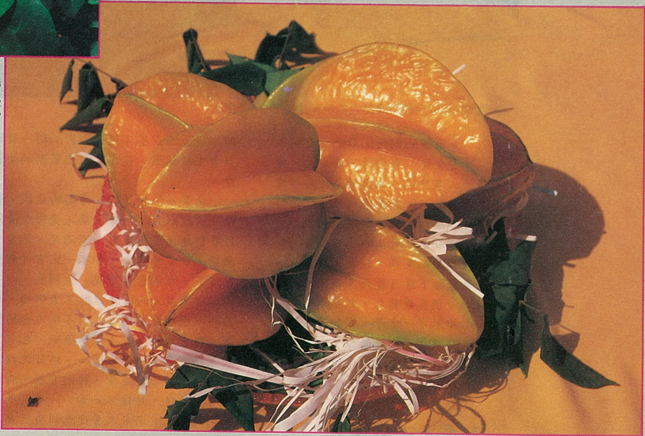
●青梗厚穩、果實碩大是姜仔寮楊桃的特徵

花壇鄉走，不到10公里路程，抵達花壇稍探詢往姜仔寮路線前往，約6公里。沿途路面平坦曲折，交通相當便捷，到處青山綠水，風光明媚，景色怡人