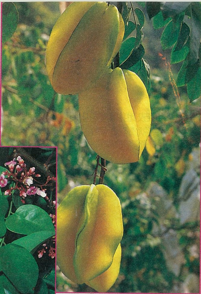
●姜仔寮楊桃觀光果園開放參觀