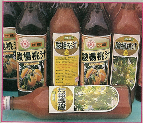
●彰化市農會出品的楊桃汁