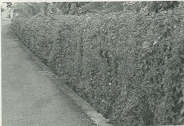
露地栽培成長最好。

炮仗花喜充足的日照，生性強健，栽培土質以富含有機質的壤土為佳，適露地栽培，若為屋頂花園須選擇大而深的花槽，定植前於土壤中添加有機肥為基肥，以後每季施用一次腐熟液肥或化學肥料即可。定植後忌強光照射，須加以遮蔭，待生長較佳後再給予充份的日照；但成株光線不足亦影響開花。幼株須立支柱，使其攀緣，再蔓生於棚架或屋頂、圍牆，當株高達2公尺時須加以摘心，以促進分枝，增加開花數。生育適溫為18~30℃，栽培土壤須保持潮濕，尤其是生育初期，以免影響生長。花期過後應加以修剪整枝，施“禮肥”（慰勞她開花期的辛苦，補補身子），更能促進新枝生長，使生育更佳；須注意氮肥勿過量，以免枝條徒長，影響開花。