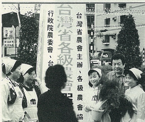
試辦期間，舉辦甜茴香品嘗會。(陳添來 攝)