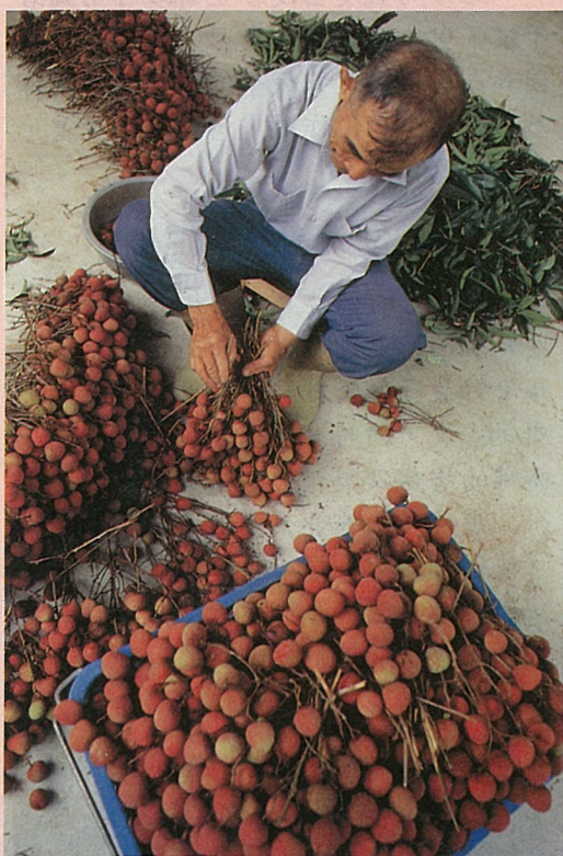
果園內出售新鮮荔枝