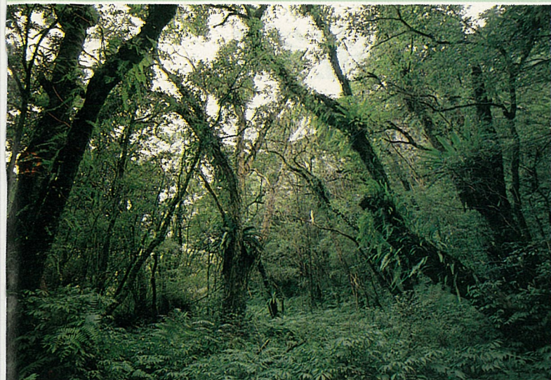
湖畔原始闊葉林自然保護區