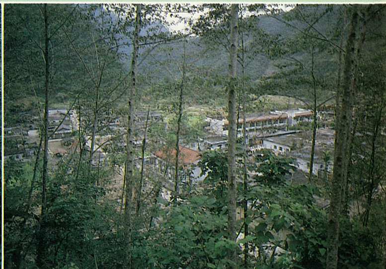
前往神秘湖必經之金洋村部落

宜 蘭縣南澳鄉，近年來以純淨、幽美的南、北溪聞名，其中南溪更是農業學者與保育專家，投放香魚復育計劃的基地，台灣省漁業局已放流了十萬尾香魚苗，期使南溪重享“台灣香魚的故鄉”美譽。而與南溪同享盛名的神秘湖（南澳湖泊），由於深居群山環抱裏，平添幾許神秘、詭麗的氣息，堪稱是“深山蘊藏幽夢影，世外桃源神秘湖”。