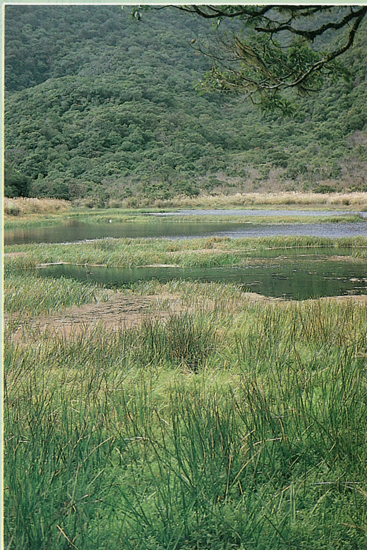
湖面長滿水生植物

湖的四週林野茂密，清新翠綠，極富原始情趣，部份古木傾斜湖面，形態嵯峨怪異，加上枝幹上