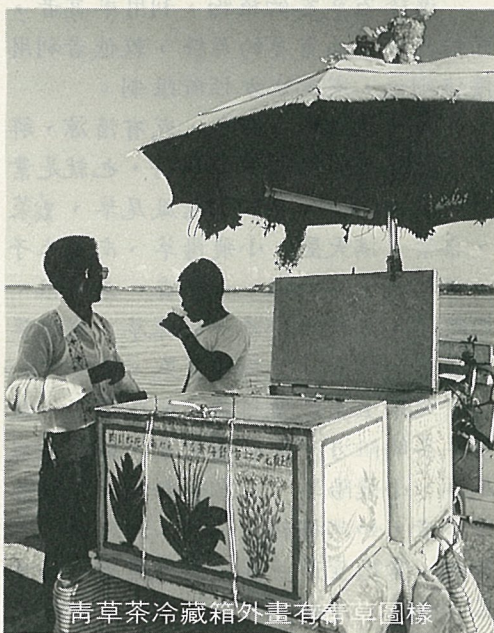
青草茶冷藏箱外畫有青草圖樣