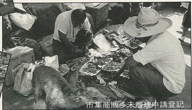
市集商販多未辦理申請登記