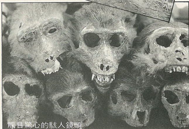
觸目驚心的駭人鏡頭