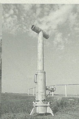
新引進的自動瓦斯點爆器

這場人鳥之戰的戰場，分佈在高雄縣永安鄉與台南縣七股、北門二鄉臨海的塩田。這裡放養的是虱目魚苗，供海釣釣餌之用。占地6~7分的塩田，每年7、8月間收成，每尾虱目魚苗7~8元，每月收成3次，每次約1萬尾，每月收入20萬餘元。