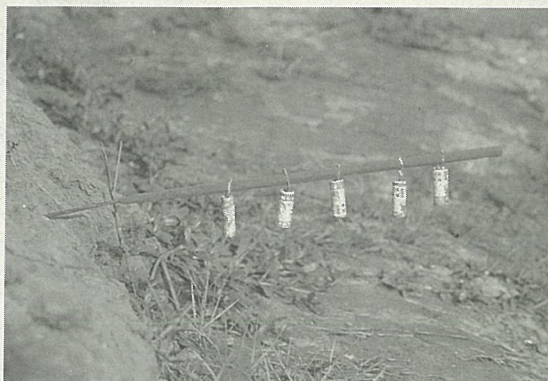
點燃鞭炮嚇走白鸞鸞，遇雨就行不通了。