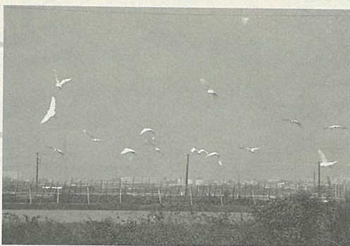
鸞鸞盤旋塩田上空準備掠食