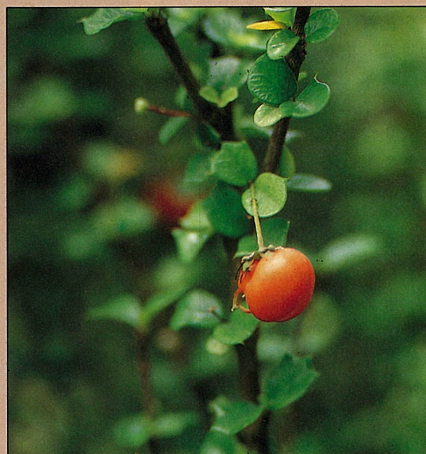
櫟葉櫻桃可食亦宜觀賞