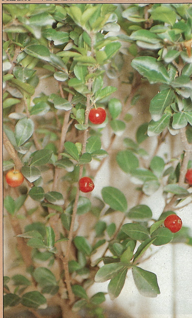
西印度櫻桃是近年來花市的寵兒