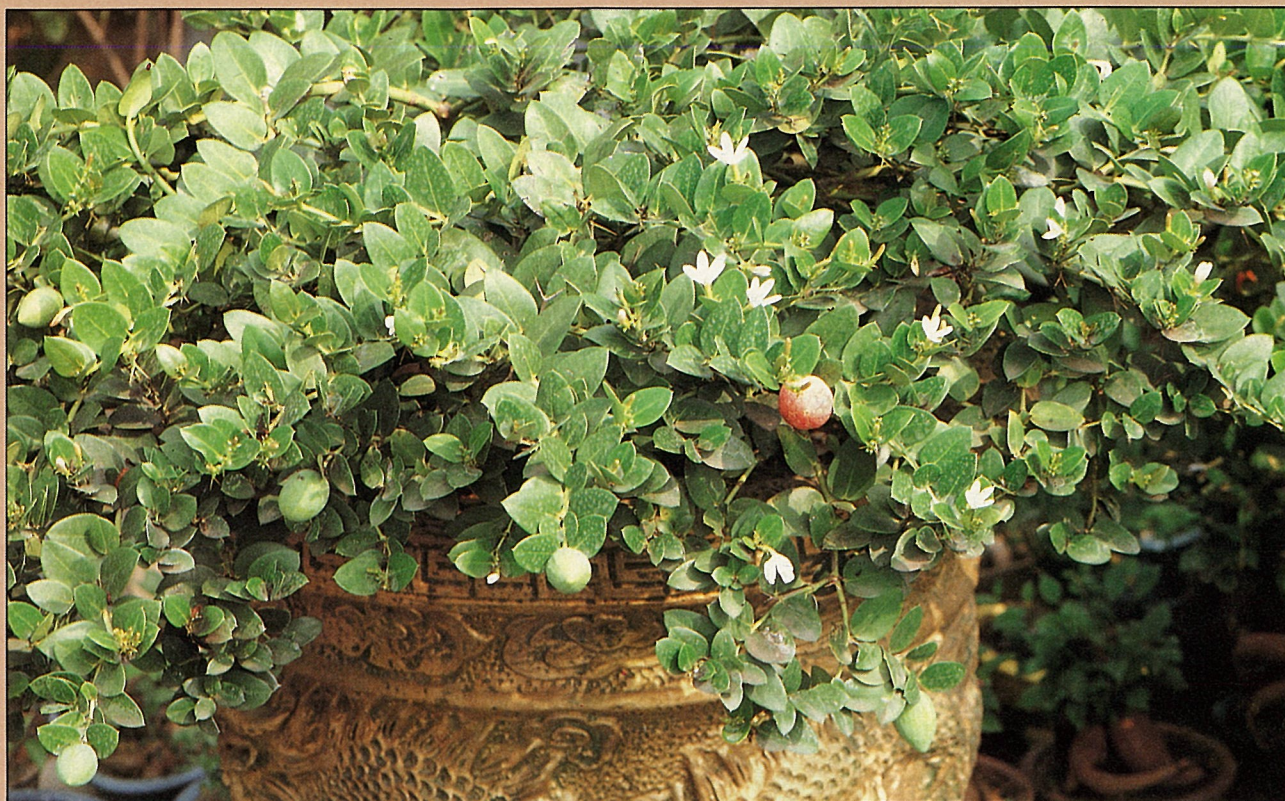
美國櫻桃一年四季經常開出白色花朵，然後結果。