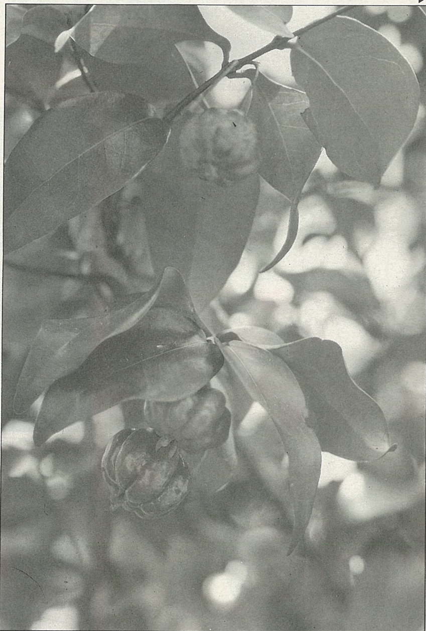
扁櫻桃是理想的綠籬材料

除了真正的櫻桃外，其它各種櫻桃都適合在本省平地生長，而且生長得都很不錯，病虫害不多，同時維護管理的工作也算輕省，除了果可食用外，是一群可愛的觀果植物。