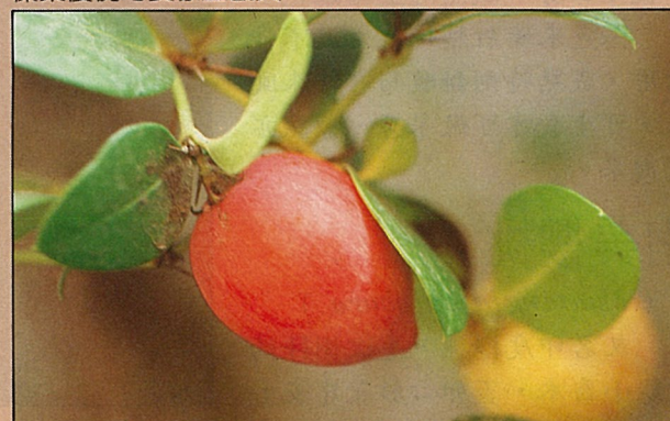
美國櫻桃又名卡利撒，紅果略呈心形。