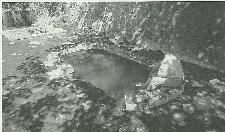
桃源溫泉的溪谷中

(5) 梅山溫泉——隸屬於梅山村，由村落步行到溫泉露頭處，需費時兩個鐘頭，因路徑不好找，最好由當地居民帶路。溫泉露頭處有三，水量均十分豐富，泉質為弱鹼性碳酸泉，氫離子濃度為7.5，清澈透明可以飲用，泉溫在75℃左右，屬高屏溪水系的變質岩區溫泉露頭。由於地處荒谷偏僻的角落，交通困難，故迄今尚未開發，3處溫泉均呈原始狀態。